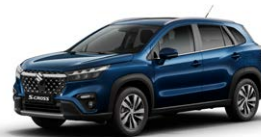
Sphere Blue Pearl