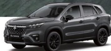
Titan Dark Gray Pearl Metallic