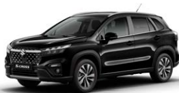
Cosmic Black Pearl Metallic