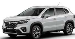
Cool White Pearl