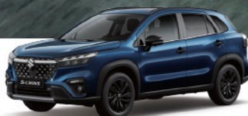
Sphere Blue Pearl