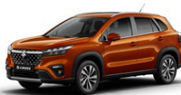
Canyon Brown Pearl Metallic