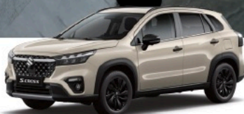
Savanna Ivory Metallic