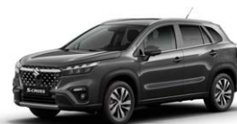
Titan Dark Gray Pearl Metallic