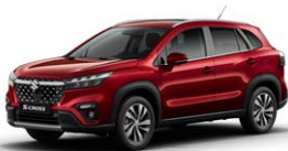
Energetic Red Pearl