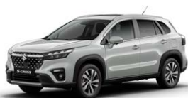
Silky Silver Metallic