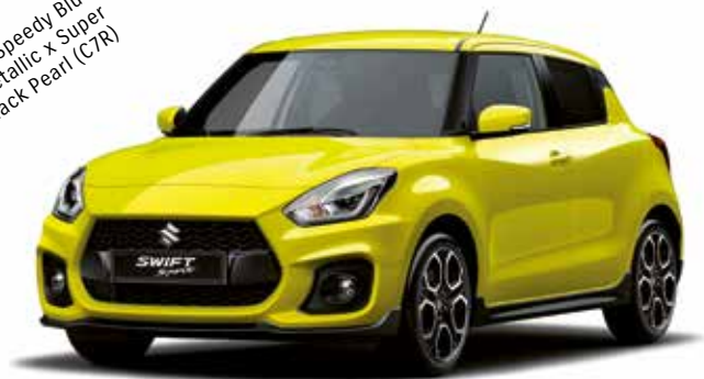
Champion Yellow (ZFT)