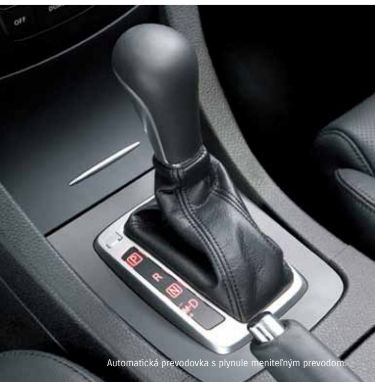
Automatická prevodovka s plynule meniteľným prevodom.

Od prvého momentu, ako sa s Kizashi ocítate na ceste, pocítite silu, ktorú držíte pevne v rukách. To je sila ovládania. Bez najmenej námahy budete akcelerovať a vďaka bezstupňovej prevodovke (CVT) sa môžete tešiť z rýchlej, pohodlnej a úspornej jazdy. Pokrokové technológie sa už postarajú o to, aby ste za každou zákrutou pocítili nával slobody.