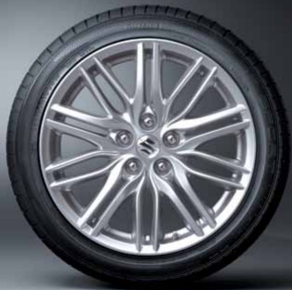
Športové 18-palcové kolesá.