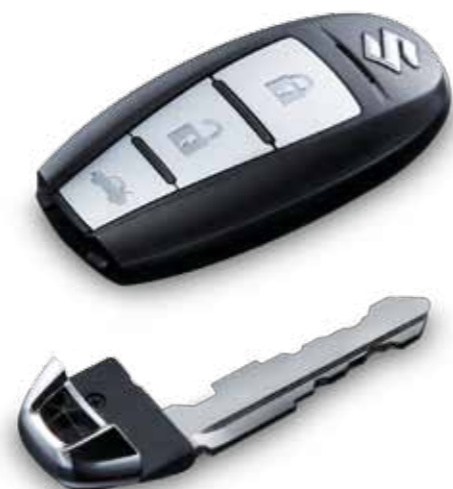
Elektromagnetický ovládač bezkľúčového odomykania a štartovania