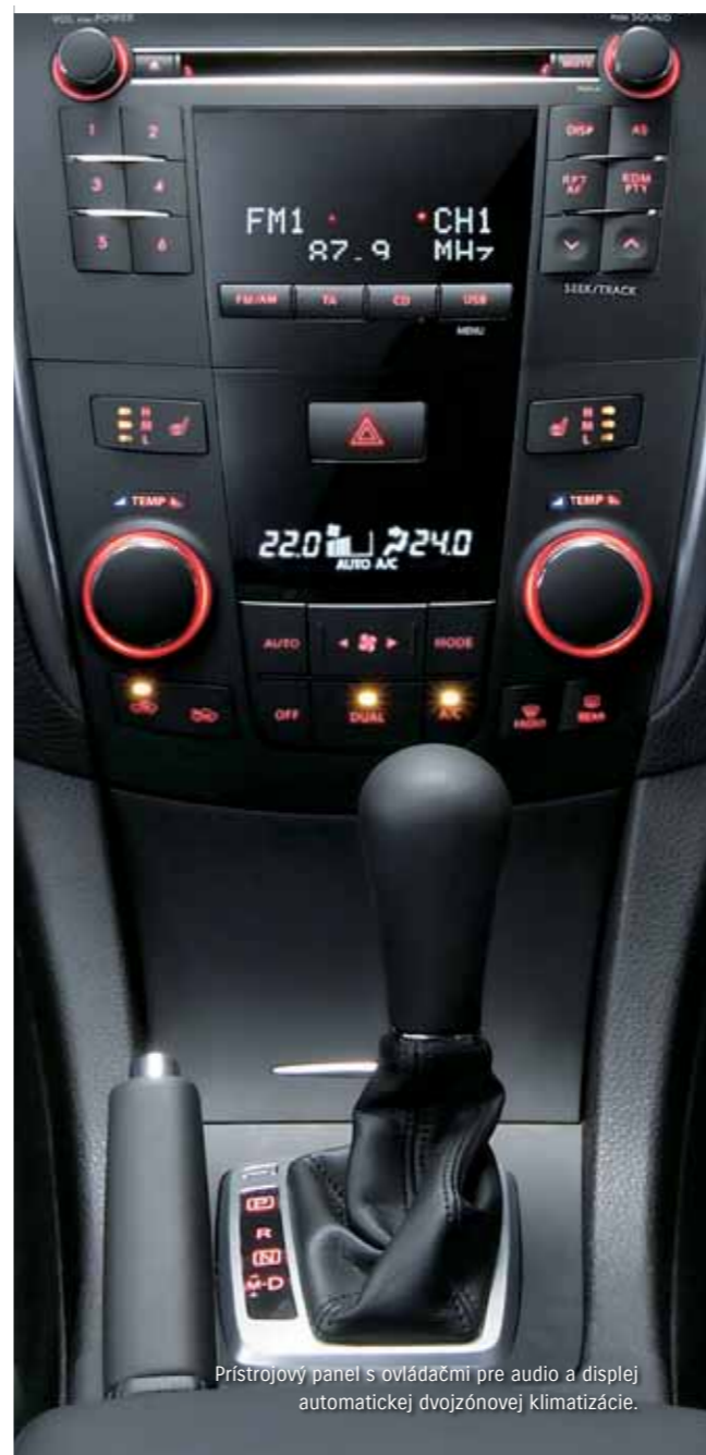
Pristrojový panel s ovládačmi pre audio a displej automatickej dvojzónovej klimatizácie.