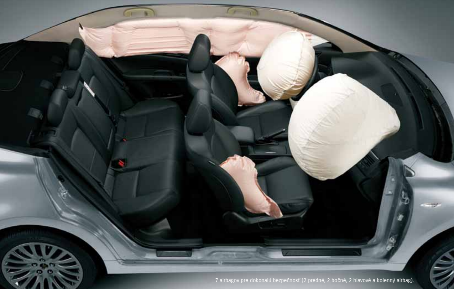
7 airbagov pre dokonalú bezpečnosť (2 predné, 2 bočné, 2 hlavové a kolenný airbag).