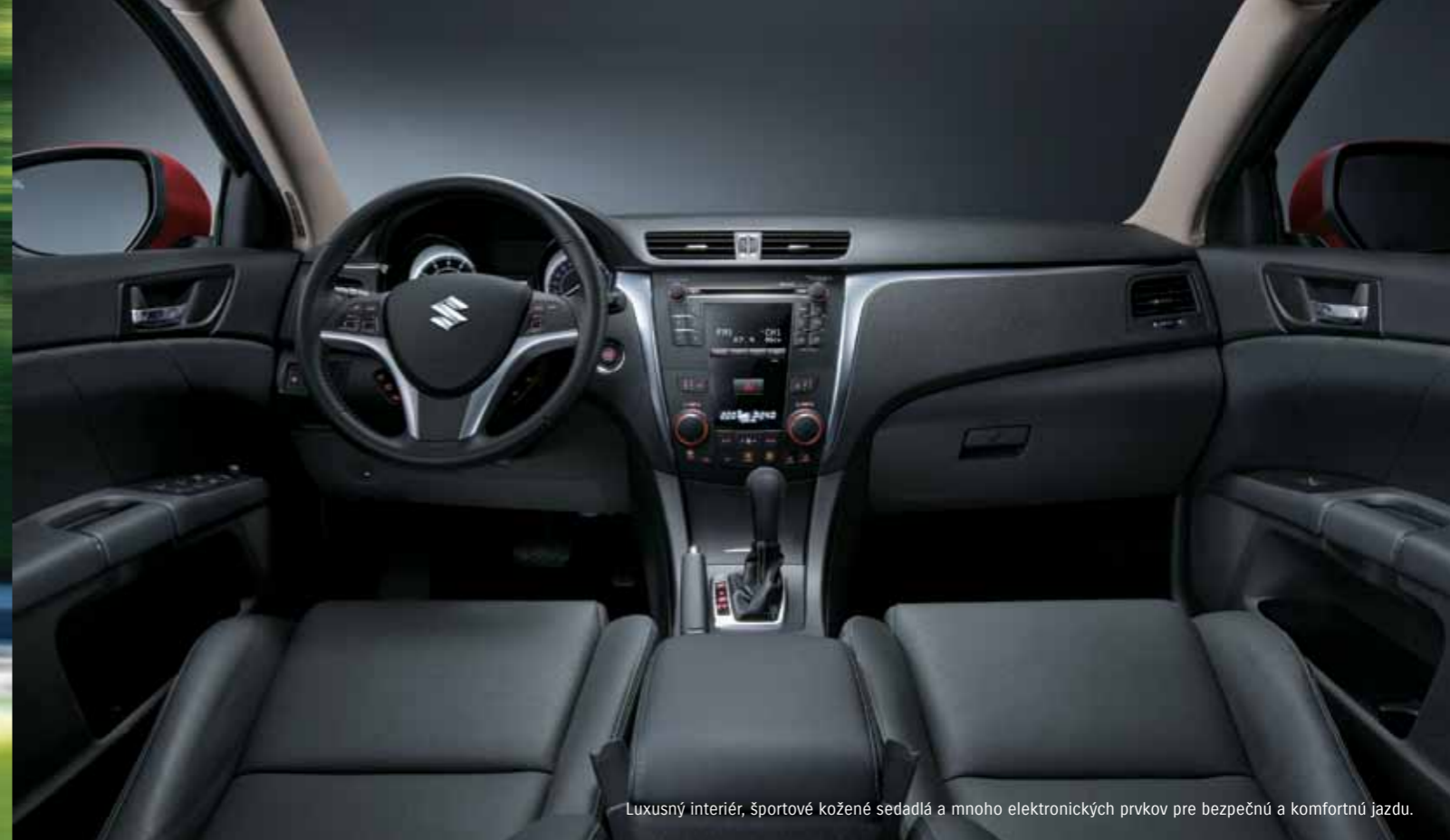
Luxusný interiér, športové kožené sedadlá a mnoho elektronických prvkov pre bezpečnú a komfortnú jazdu.