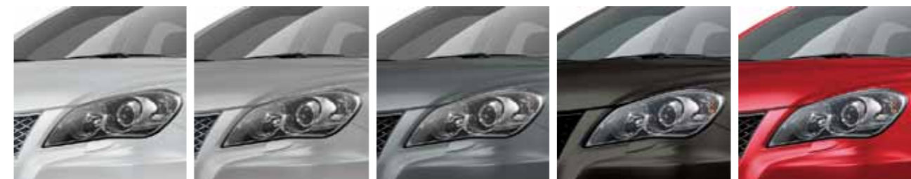
Snow White Pearl Metallic (ZMT)

** : Najvyššia rýchlosť otáčok motora pri automatickej prevodovke CVT je obmedzená na 6 000 ot. kvôli ochrane CVT systému.